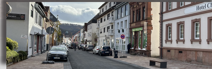
Blick in die Kaiserstraße