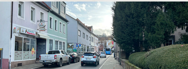
Blick in die Ludwigstraße

Wichtig ist eine frühzeitige Kontaktaufnahme und eine individuelle Beratung durch das Sanierungsteam der Stadt Landstuhl, um eine reibungslose Abwicklung der Förderung zu gewährleisten.