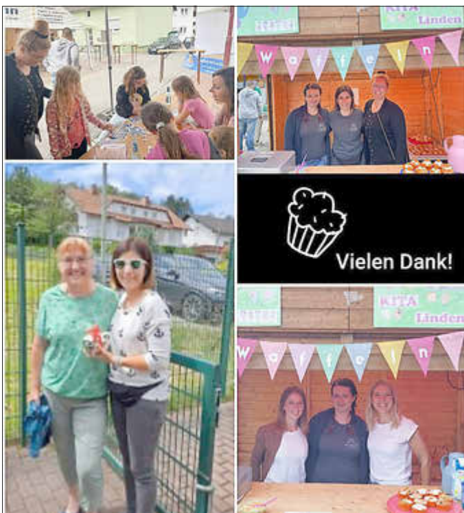
Am 22.6.24 war es soweit, Vinolindo stand vor der Tür.