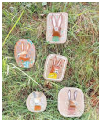
Osterbasteln Protestantische Kirche Krickenbach - Hasenbilder aus Eierkartons

Osterbastelaktion des Kindergottesdienst-Teams Schopp-Linden-Krickenbach als Angebot der Kooperationszone „Moosalb-Brücke“