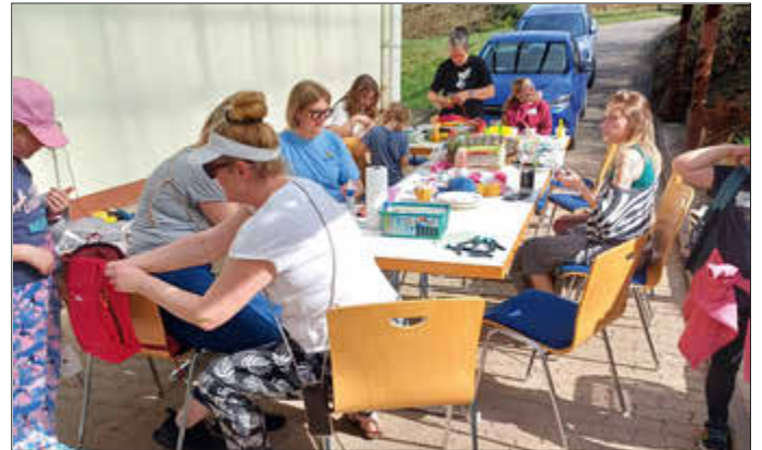
Osterbasteln - Protestantische Kirche Krickenbach