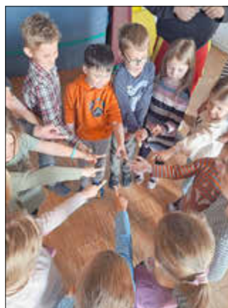
Die Kinder zeigen ganz stolz Ihren Pflasterverband

Am 27.03.2025 erlebten die Vorschulkinder der integrativen Kindertagesstätte „Arche Noah“ des Ökumenischen Gemeinschaftswerk Pfalz GmbH einen ganz besonderen Tag. Der Rettungssanitäter kam in seiner Arbeitskleidung und somit war er von den Kindern gleich zu erkennen. Den Vorschulkindern wurde erklärt, wie man sich bei Verletzungen richtig verhält. Die Kinder bekamen eine praktische Anleitung zum Absetzen des Notrufs. Danach wurden Pflaster fachgerecht angebracht und Verbände angelegt. Der Besuch vom ASB war für die Kinder der „Arche Noah“ nicht nur lehrreich, sondern