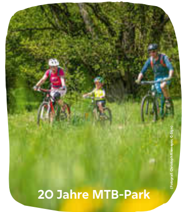
20 Jahre MTB-Park