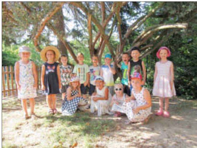
(Text und Foto: Kita Hauptstuhl)