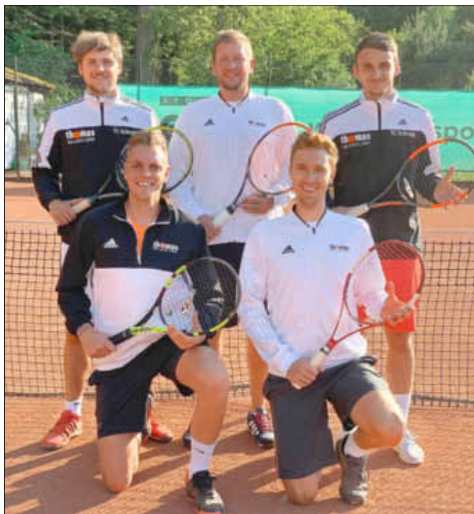
Meisterteam Herren B-Klasse Gruppe 01 - Aufstieg in die A-Klasse

Bildnachlese zum Artikel vom 7. Juli 2019