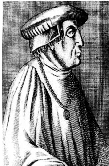
Sickingen in Bellum Sickinganum, 1626

Historiker nennen ihn häufig den „Einzigen Condottiere großen Stils auf deutschem Boden“, der bereit ist, seine Dienste und die seiner Soldaten jedem zur Verfügung zu stellen, dessen Anliegen wirtschaftlichen Gewinn verspricht. Auch in der Methode ähneln die militärischen Unternehmungen des Ritters den „Kriegszügen“ in Italien: Der Söldnerführer stellt überraschend schnell eine eindrucksvolle Streitmacht auf, die dann in einem taktisch klug ausgeführten Schachzug den Gegner - meist eine Stadt - stellt, ohne dass es zu einer größeren blutigen Auseinandersetzung kommt. Natürlich bringen die bewaffneten Konflikte ungeheures Leid vor allem für die Bewohner der ungeschützten Dörfer. Für die Truppe ist dies aber ein Geschäft meist ohne Risiko, weshalb man begeistert dem nächsten Ruf folgte. Sickingen führt seine Fehden häufig mit der Tolerierung seines Landesherrn, dem Pfalzgrafen, und oft scheinen sich die sickingischen Unternehmungen im Sinne habsburgischer Reichspolitik zu bewegen, obwohl mehrfach kaiserlich verkündeter Reichsfrieden gebrochen wird. Als Sickingen bei den Habsburgern für einige Zeit in Ungnade fällt, weil gegen ihn 1515 eine unwirksame Reichsacht (bis 1518) verhängt wird, nimmt er für einige Zeit (1516) Dienst beim König von Frankreich.