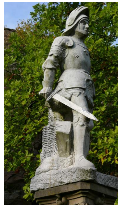
Denkmal auf der Burg um 1890

Die Theologen sind Reformatoren im oberdeutschen Raum, wo es auch einflussreiche Ansätze zu einer Neugestaltung gibt. Ihre divergierenden theologischen Positionen fächern sich zu mehrere „Reformationen“ auf. So ist Luther nur einer der Erneuerer – aber für viele bis heute die Personifizierung der Reform. Die sickingischen Burgen Ebernburg und Nanstein werden für zwei Jahre Zentren des reformatorischen Strebens im Südwesten des Reiches, wo wahrscheinlich auch die ersten Gottesdienste in deutscher Sprache gefeiert, die Predigt nach Texten der Bibel im Mittelpunkt der Liturgie steht und das