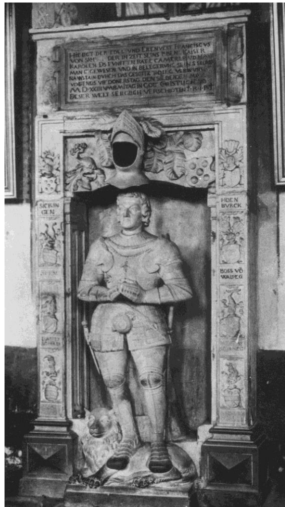
Grabdenkmal 1543 - Foto 1886

Wenig beachtet haben Chronisten, dass die finanziellen Möglichkeiten des Handelnden inzwischen drastisch eingeschränkt sind, und er dazu seit Längerem an einer scheinbar chronischen, schmerzhaften Erkrankung der Bewegungsorgane leidet, die nach den Erkenntnissen moderner Mediziner auch zu Veränderungen der Psyche führen kann. So geht Sickingen im Spätsommer 1522 den Weg des Kriegers, der sich mit den überholten Rechtsmitteln einer mittelalterlichen Fehde in den Besitz eines Kurfürstentums setzen will. Er scheitert aber an der Führungsgestalt des Erzbischofs von Trier, Richard von Greiffenklau, einem Standesgenossen, der sich bei der Abwehr auf die Gesamtheit seiner Untertanen, auch auf die Ritter und die Befürworter einer Kirchenreform stützen kann.