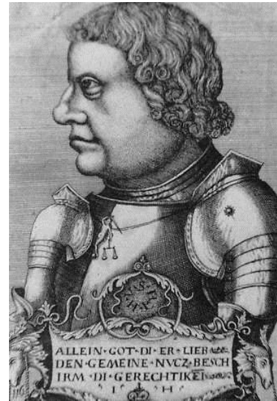
F. v. Sickingen – H. Hopper 1520